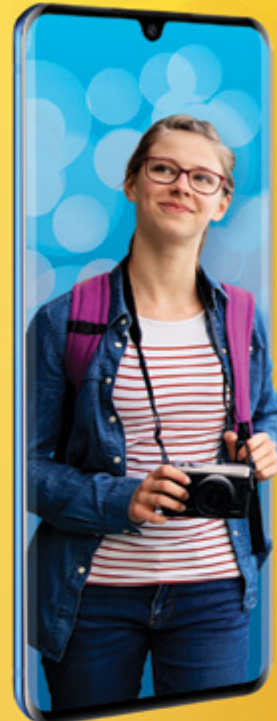
ZTE AXON 10 PRO