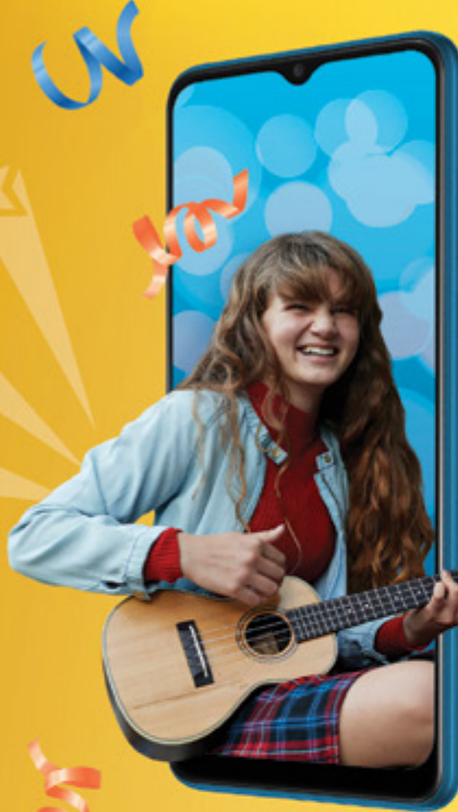
ALCATEL 3X (2019)