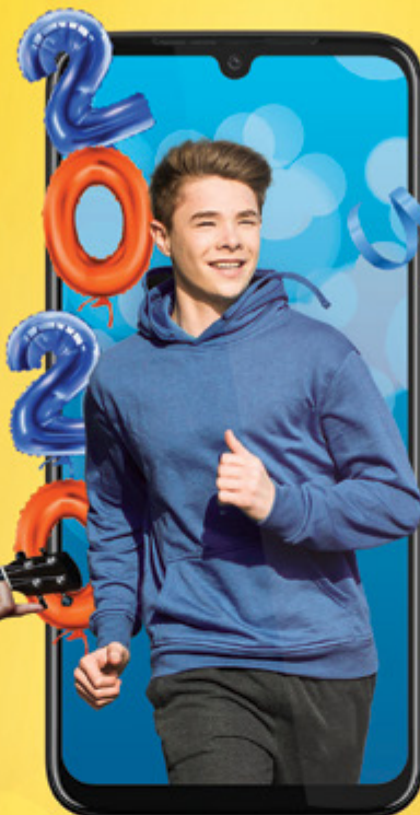
moto g8 PLUS